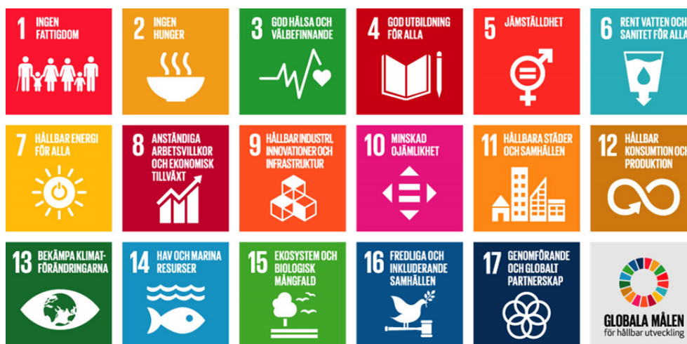
Figur 1. De globala målen för hållbar utveckling

Agenda 2030 och de globala målen antogs av världens stats- och regeringschefer vid FN:s toppmöte i New York, den 25 september 2015. Agendan består av 17 mål och 169 delmål för hållbar utveckling. Målet är att till år 2030 genomföra en samhällsförändring som leder till en ekonomiskt, socialt och miljömässigt hållbar utveckling som skyddar vår planet, utrotar fattigdom och genererar en god välfärd för alla människor. Globala målen är integrerade och odelbara och balanserar de tre dimensionerna: den ekonomiska, den sociala och den miljömässiga. De tre dimensionerna måste samverka och förhålla sig till varandra för att kunna bidra till en hållbar utveckling. Världens regeringar är ansvariga, men de globala målen berör oss alla och kommunen är en viktig aktör för att nå målen.