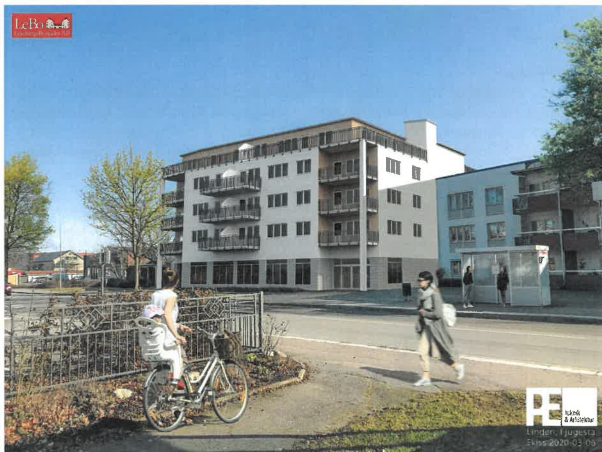
Bild 2 Gestaltning av trygghetsboende Kv Linden

Kv Linden erbjuder allt ovan och det finns också möjlighet att samverka med den kommunala socialtjänsten om så skulle behövas.