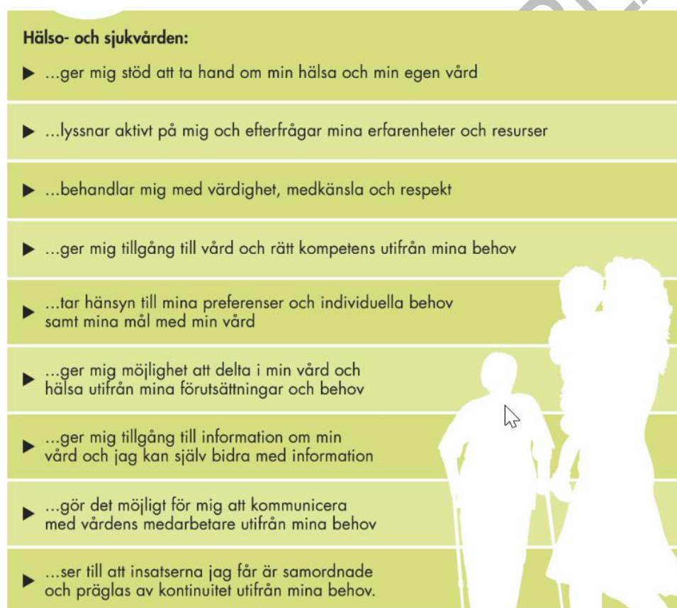
Figur 2. Källa: Baseras på internationella och nationella definitioner och beskrivningar av personcentrering samt diskussioner med myndighetens patient- och brukarråd. Från mottagare till medskapare, Vårdanalys.