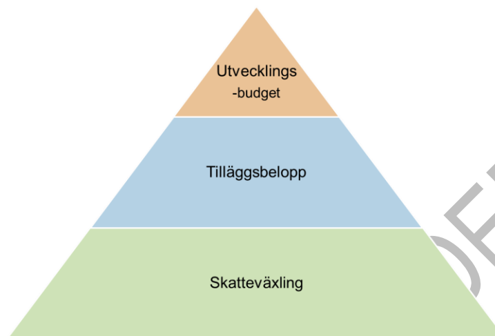
Figur 5. Modell för ekonomisk reglering mellan kommun och region

Den ekonomiska modellen baseras på samma grunder som tidigare använts med skatteväxling och tilläggsbelopp. Skatteväxlingen är oförändrad medan tilläggsbelopp uppdateras och utökas jämfört med tidigare överenskommelse. Specifika satsningar hanteras i utvecklingsbudget.