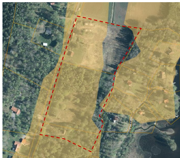
Ras- och skred illustreras med orange område

Inom området kan det finnas risk för ras och skred. Stora delar av det ansökta området hamnar inom det aktsamhetsområde som pekas ut.