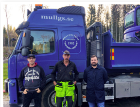
Mullhyttans Gräv & Schakt

Vill du också få ett besök och prata om ditt företag? Skicka ett mejl till maria.comstedt@lekeberg.se