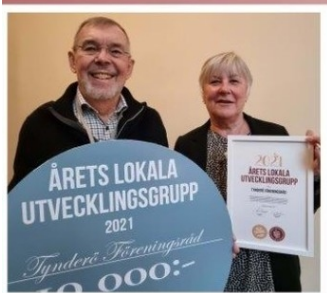
Årets lokala utvecklingsgrupp TYNDERÖ FÖRENINGSRÅD