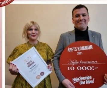
Årets kommun HYLTE KOMMUN