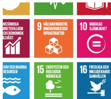
År 2015 antog FN Agenda 2030 för en hållbar utveckling.